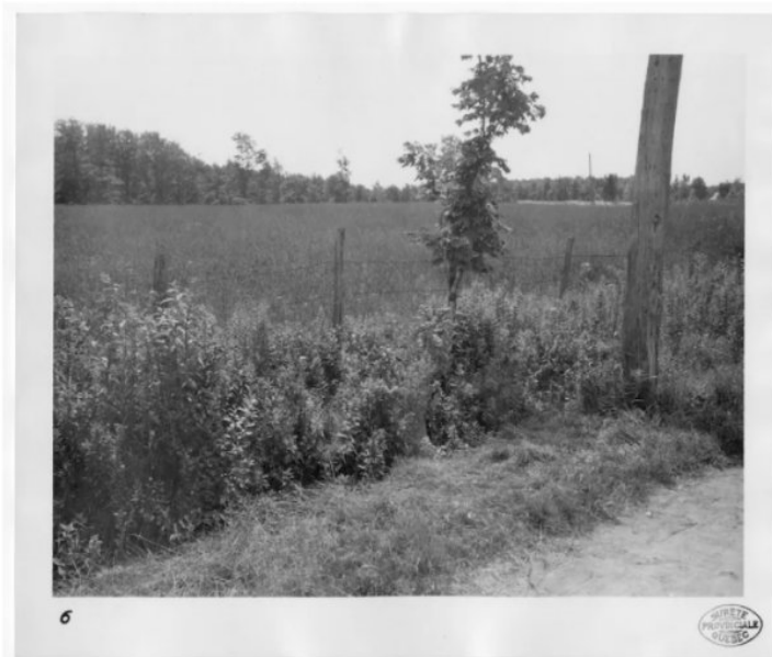
Vue du champ, de la clôture et du poteau près duquel Hector Rochette a été blessé, 30 juillet 1948