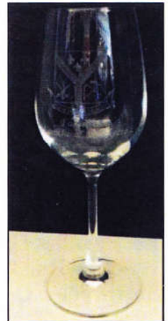
Coupe à vin gravée des armoiries de l'association: 10$ chacune, 55$ pour 6, 100$ pour 12.