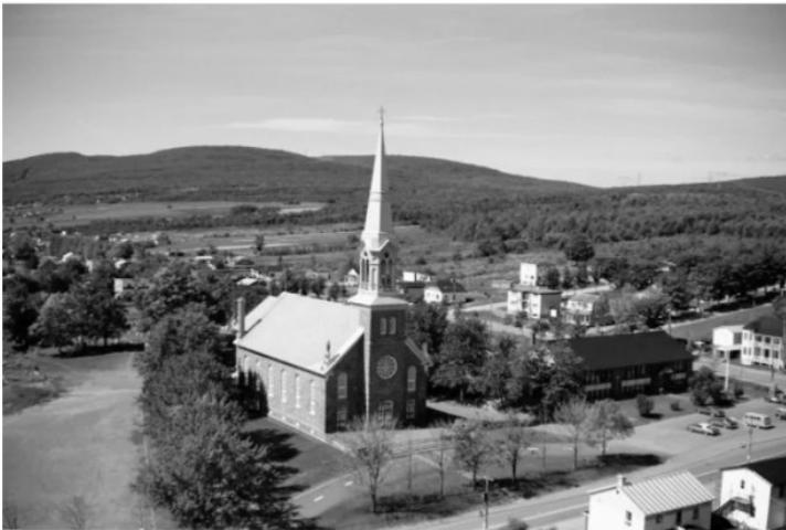
Vue de l'église de Saint-Gérard-Majella, 1977

Le mercredi 28 juillet 1948 est une journée d'élections provinciales. C'est le cas à Saint-Gérard-Majella (aujourd'hui Val-Bélair), une petite communauté rurale de moins de 1500 habitants à 30 km au nord-ouest de Québec. «C'était une journée où il y avait beaucoup de monde gai», confirme un habitant des lieux. Au centre du village, l'épicerie-restaurant d'Alfred Boivin est un lieu de rencontre où l'on mange et où l'on consomme de l'alcool. Ces réjouissances se termineront malheureusement de manière dramatique.