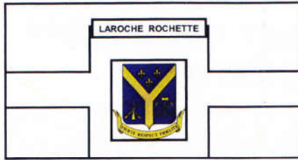
Drapeau de table (10" x 6") 5,00$ Drapeau (6' x 3') 60,00$