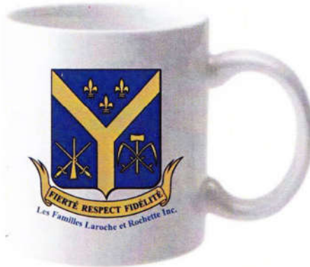
Tasse décorée des armoiries de l'association: 10$ chacune, 55$ pour 6, 100$ pour 12.

Achetez des livres ou des articles pour affirmer votre fierté de faire partie de nos familles.