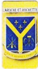
Jeu de cartes 10,00$

Achetez des livres ou des articles pour affirmer votre fierté de faire partie de nos familles.